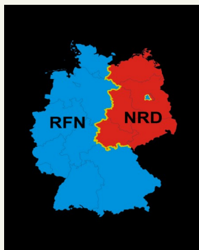
Podział Niemiec na 2 państwa

3 października obchodziliśmy 27 rocznicę Zjednoczenia Niemiec (niem. Tag der Deutschen Einheit), co było największym wydarzeniem lat dziewięćdziesiątych.