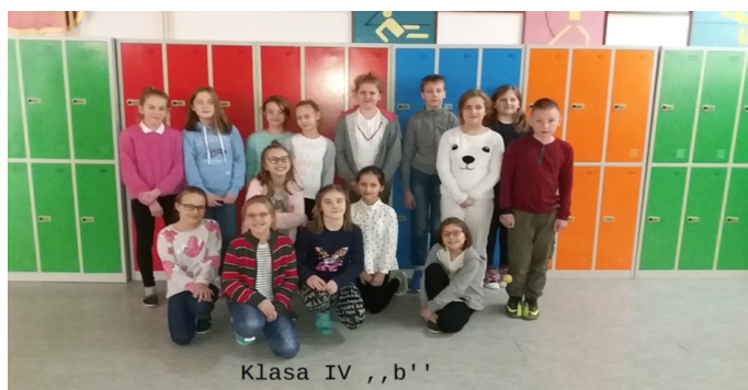
Klasa IV ,,b''